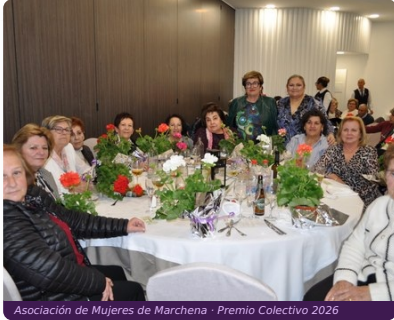
Asociación de Mujeres de Marchena · Premio Colectivo 2026