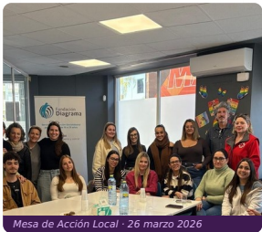
Mesa de Acción Local · 26 marzo 2026

Fundación Diagrama · Lorca · 12:00 h · 10 entidades