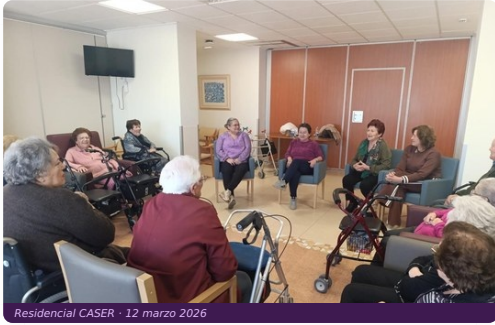
Residencial CASER · 12 marzo 2026

12 de marzo · 10:30 h · Residencial CASER · Lorca