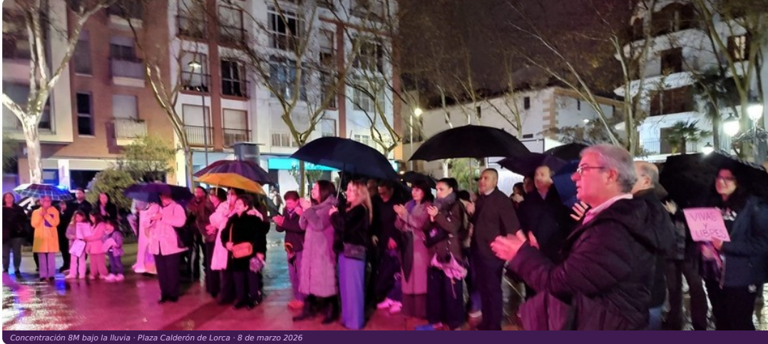
Concentración 8M bajo la lluvia · Plaza Calderón de Lorca · 8 de marzo 2026

8 de marzo · 19:30 h · Plaza Calderón · FOML · Lorcairis · Mujolor