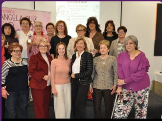
XVII Premios Ángela Ruíz Sánchez