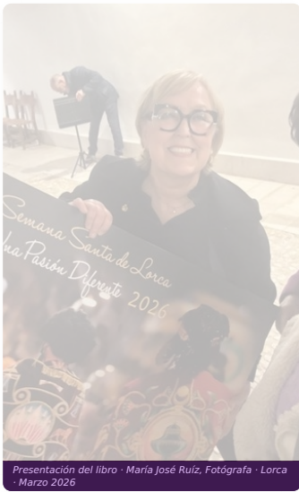
Presentación del libro · María José Ruíz, Fotógrafa · Lorca · Marzo 2026