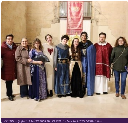
Actores y Junta Directiva de FOML · Tras la representación

La España medieval. Doña Jimena, viuda del Cid, atrapada entre la gloria del héroe y su derecho a seguir viviendo. Antonio Gala plantea una reflexión sobre el papel de la mujer, el peso de los mitos y el derecho a la felicidad individual.