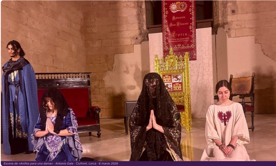
Escena de «Anillos para una dama» · Antonio Gala · Ciufront, Lorca · 6 marzo 2026

6 de marzo · 19:00 h · Ciufront · Iglesia de Santa María la Mayor, Lorca