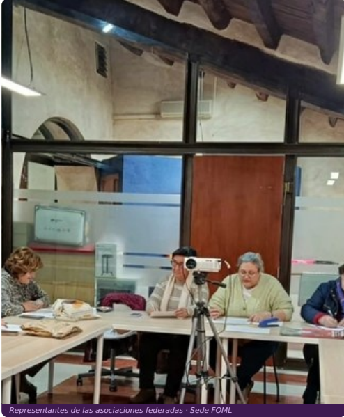
Representantes de las asociaciones federadas · Sede FOML

Aprobación de cuentas, informe de actividades del año anterior y plan de trabajo 2026. La democracia interna de FOML en acción: más de 45 asociaciones federadas, una sola voz.