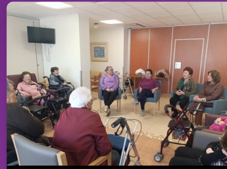
Diálogo Intergeneracional · CASER