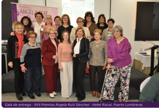
Gala de entrega · XVII Premios Ángela Ruíz Sánchez · Hotel Riscal, Puerto Lumbreras