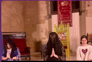
Teatro «Anillos para una dama» · 6 marzo