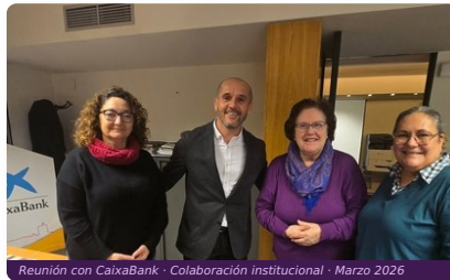
Reunión con CaixaBank · Colaboración institucional · Marzo 2026

FOML avanza en su colaboración con CaixaBank, reforzando el apoyo institucional a los proyectos y programas de la Federación para 2026.