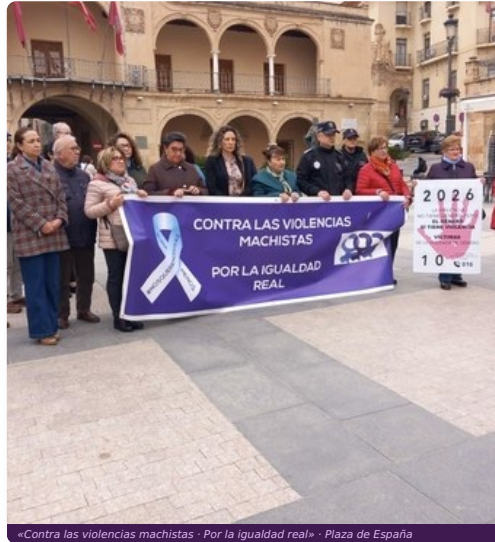
«Contra las violencias machistas · Por la igualdad real» · Plaza de España

Primer miércoles de mes · Plaza de España, Lorca