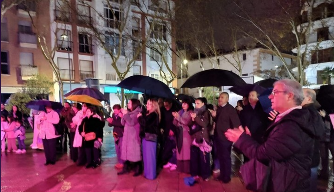
Concentración 8M · Plaza Calderón de Lorca · 8 de marzo 2026 · FOML · Lorcairis · Mujeres